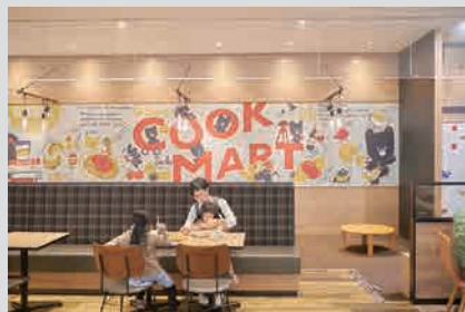
クックマート PLANNING / VI / CI / COPYWRITING / GRAPHIC DESIGN / WEB DESIGN