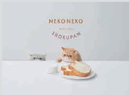
ねこねこ食パン PLANNING / VI / CI / LOGO DESIGN / COPYWRITING / PHOTOGRAPH / STYLING / GRAPHIC DESIGN / WEB DESIGN / PACKAGE DESIGN